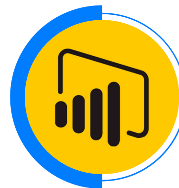
ANÁLISIS DE DATOS Y REPORTES CON POWER BI