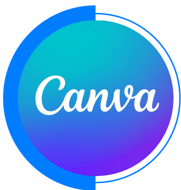
USO DE IA PARA MATERIAL AUDIOVISUAL