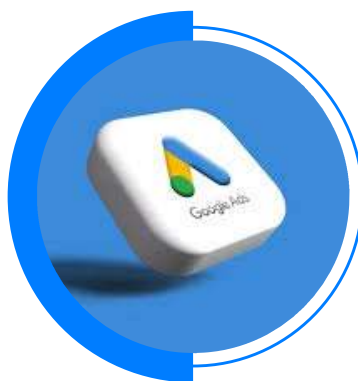
INTENCIONES DE BÚSQUEDA PARA CAMPAÑAS